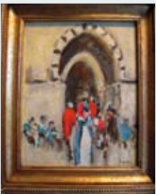
90 - B. du Tertre 100/120