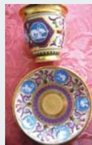
302 - 80/100