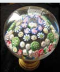
36 - boule de raÛe d'escalier CLICHY 1500/2000