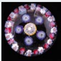
45 - SAINT LOUIS 200/250