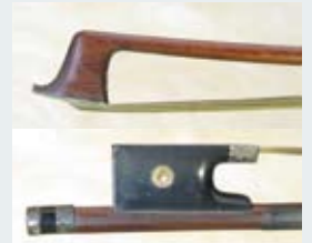
263 - 10/12000