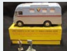
31 - 50/80