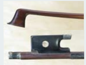
262 - 2/2500