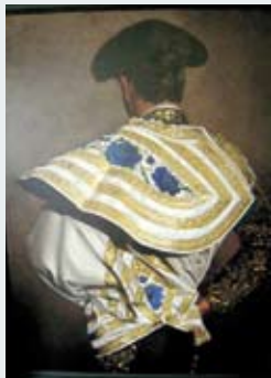
213-1 - Ch.GAILLARD 600/900