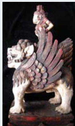
289 - 6/800